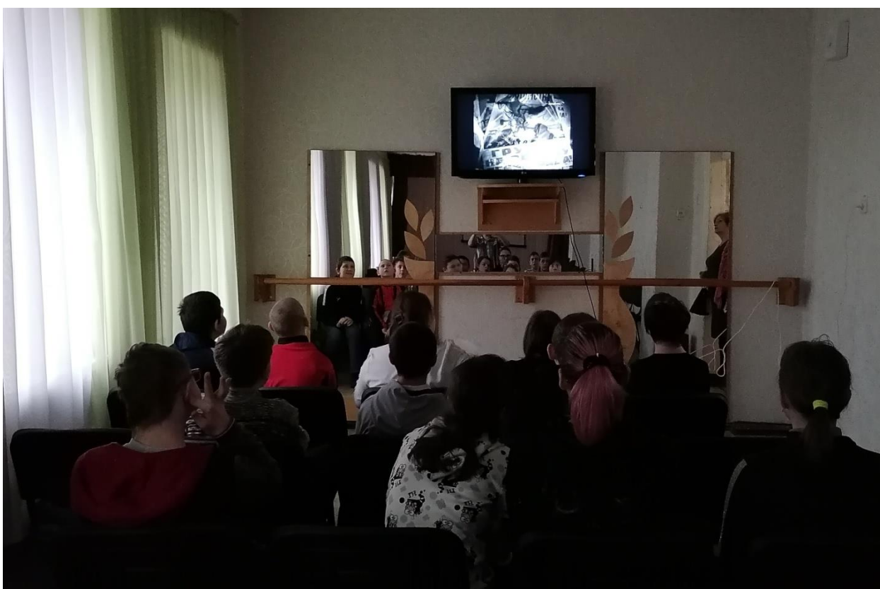
ГКОУ РО «Каменская специальная школа № 15»-просмотр художественного фильма «Жила была девочка», посвященный 80-летней годовщины прорыва блокады Ленинграда.